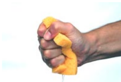
2°) Essorez l'éponge