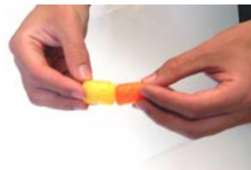
4°) Assemblez les flocons