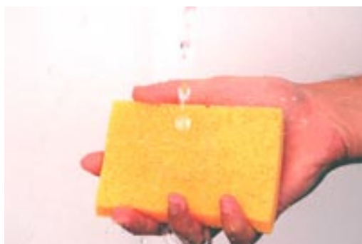
1°) Mouillez l'éponge